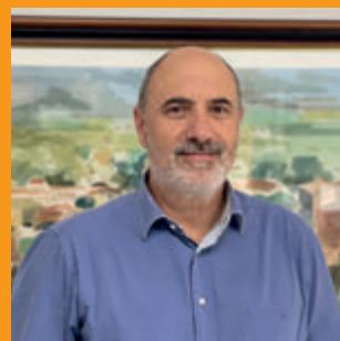
Josep Jovell i Pujulà Alcalde d'Agullana