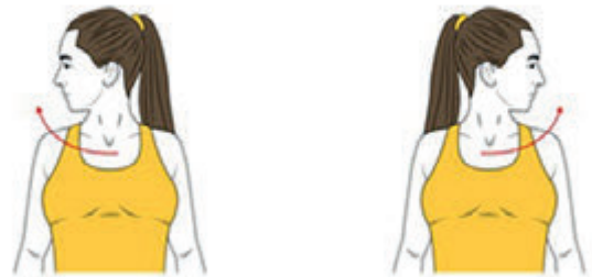
2 GIRAR EL CAP A LA DRETA I A L'ESQUERRA