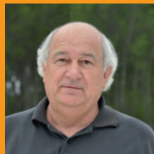
Josep Vilà i Camps Alcalde de Fogars de la Selva