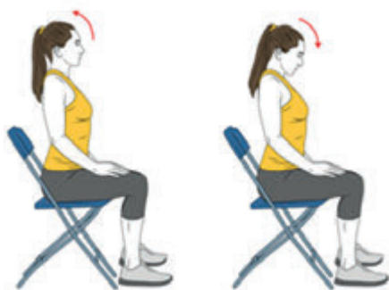
1 BAIXAR I PUJAR LA MIRADA