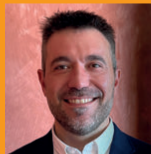
Manuel Raventós i Cuyàs Alcalde de Torrelavit